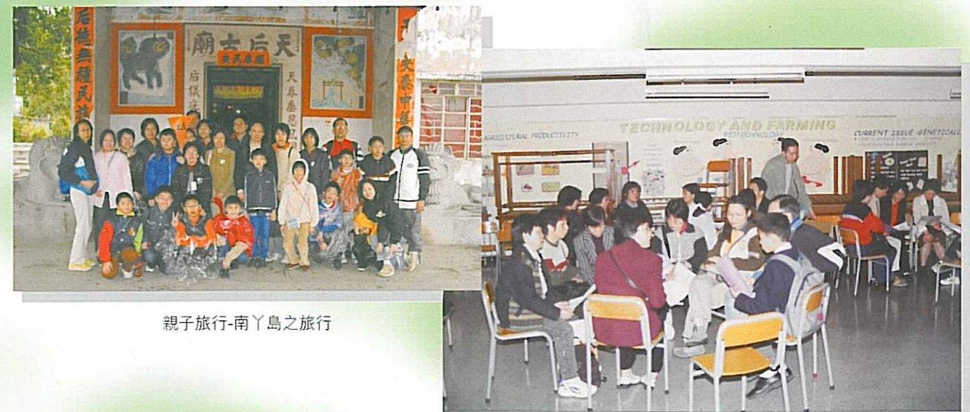
親子旅行-南丫島之旅行