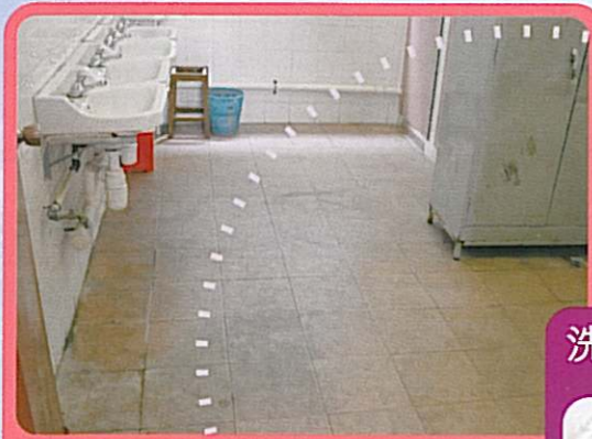
洗手間於工程前的外觀